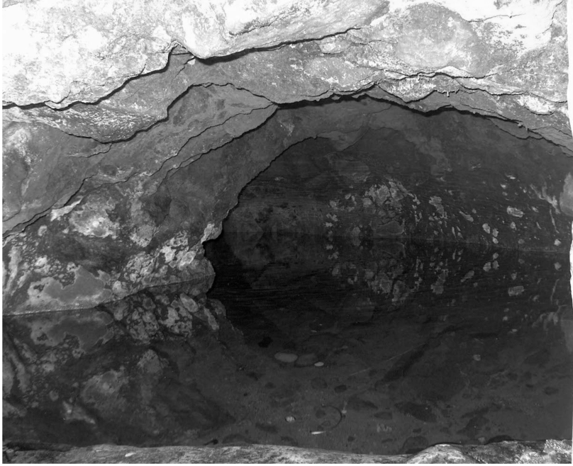
Vistas de la galería filtrante de El Salto.