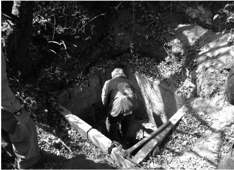
El fontanero quita la tapa del registro de la entrada a la galería filtrante del Túnel de Romero.

Los dos fontaneros se encargan de revisar el sistema, distribuir el agua, colocar nuevas tomas y el mantenimiento de los canales. Ellos son quienes tienen mayor conocimiento del sistema, dónde se ubican los manantiales, el tendido de toda la red de agua, válvulas y horarios de la distribución del líquido; también se encargan del mantenimiento y tienen un salario.