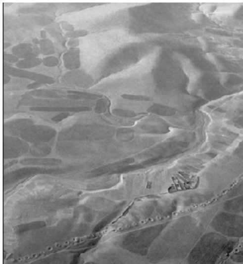
Imagen II Representación general del uso de las galerías filtrantes en el Viejo Mundo