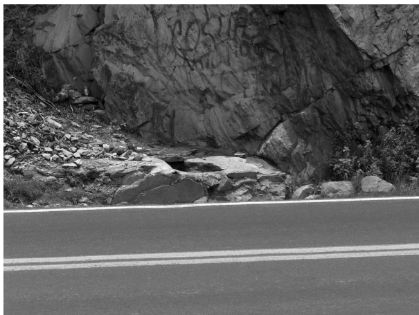
Al pie de la carretera se muestra el paraje La Herradura.

Como se observa en las fotografías siguientes, la galería denominada Ojo de Agua en el paraje La Herradura, es un sistema que tiene sólo una excavación horizontal. Su uso es público y hasta la fecha no se le ha dado mantenimiento alguno.