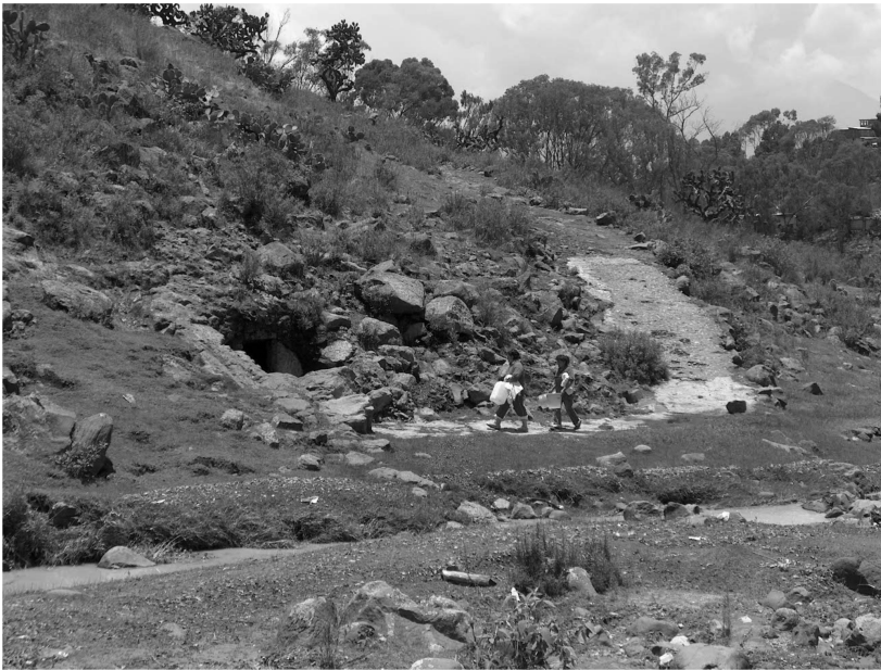
Usuarios que acuden a esta galería filtrante.