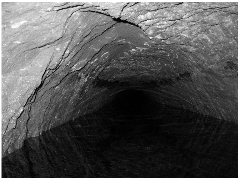
Vista interior de la galería.