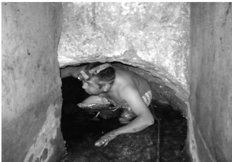
Exploración del interior del sistema.