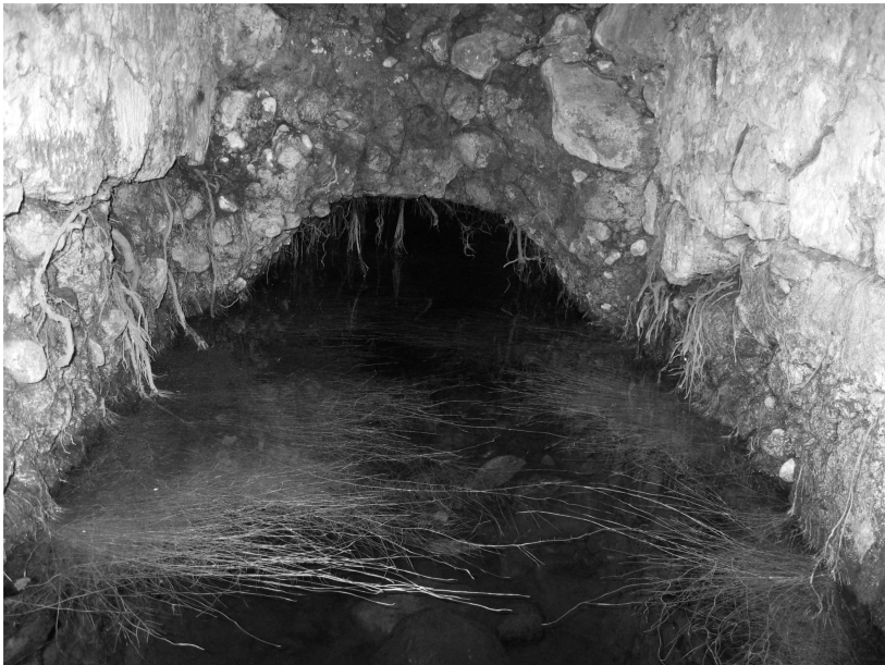
Representantes del Comité de Agua de Tepexoyuca, Ocoyoacac, muestran la galería filtrante denominada El Túnel o El Aventurero.